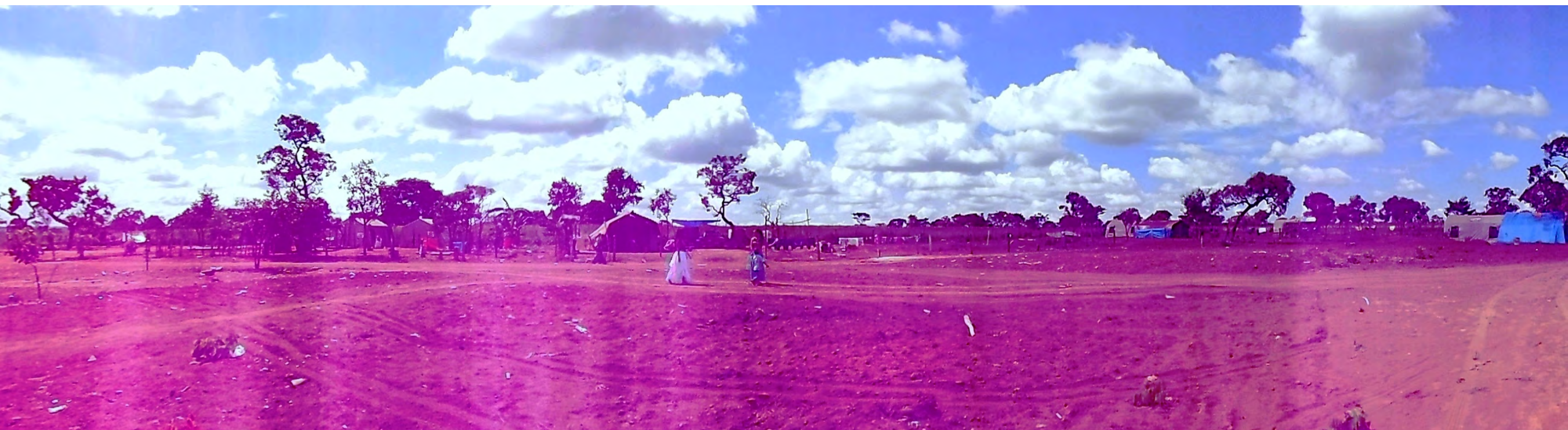
Foto panorâmica do território Calon representado pela ANEC - DF Alfredo Guerra Machado - FUNASA