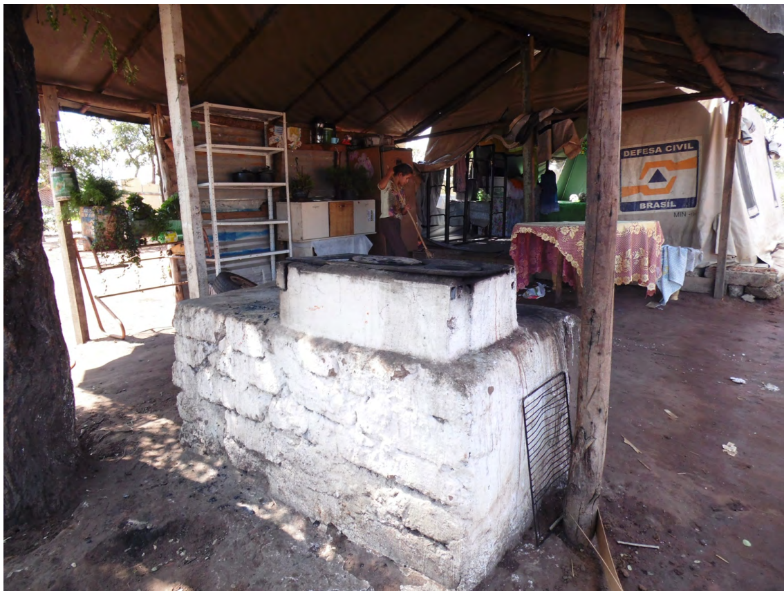
Fogão à lenha presente em algumas tendas