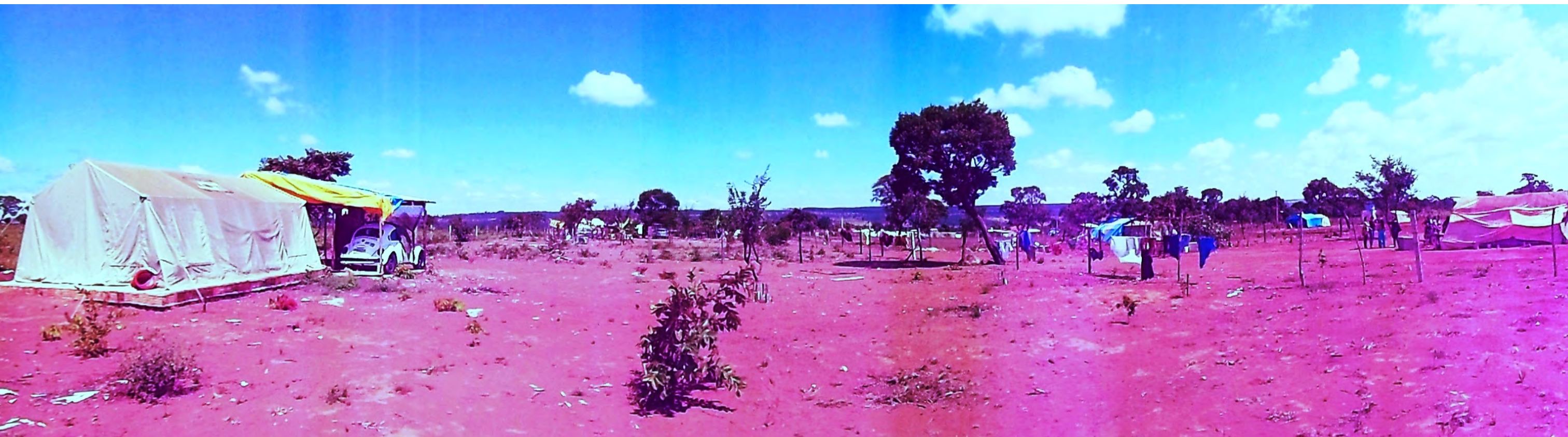
Panorâmica do território Calon representado pela ANEC- DF Alfredo Guerra Machado - FUNASA