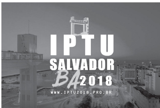
TRIBUTOS Impostos e tributos estão entre as prioridades de quem quer se manter em dia