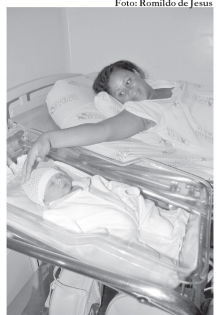
MINUTOS O garoto nasceu aos 46 minutos do Ano Novo